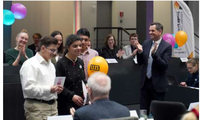
Ministerpräsident Olaf Lies gratulierte als Schirmherrn die Gewinnerinnen und Gewinner.

Die Giraffe, Gymnasium am Wall, Verden (Aller) Die Ellipse, Johannes-Kepler-Gymnasium, Garbsen INSIDER, IGS Gifhorn