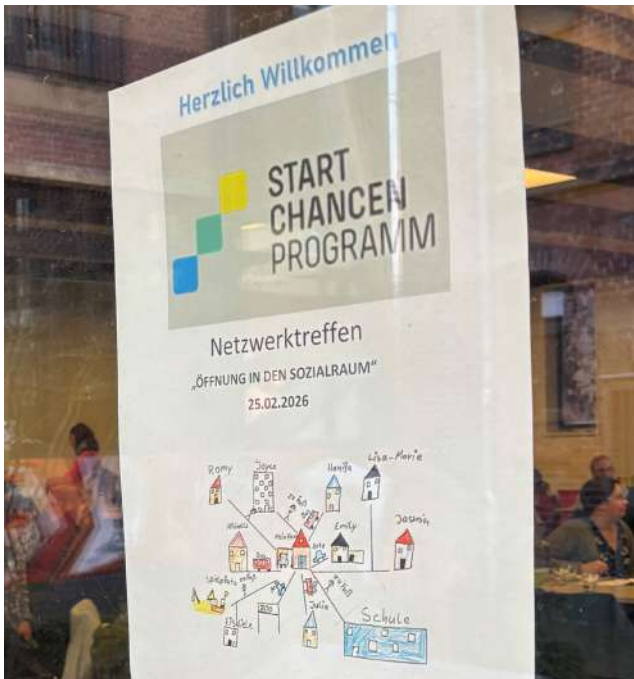
Netzwerktreffen der Schulen im Startchancen-Programm im Bereich der Regionalen Landesämter für Schule und Bildung Lüneburg.

Schule ist mehr als ein Ort der Wissensvermittlung – sie ist zentraler Lebensraum von Kindern und Jugendlichen. Die Schülerinnen und Schüler bringen unterschiedliche Lebensrealitäten, Erfahrungen und Voraussetzungen mit, die ihr Lernen und ihre Teilhabe prägen. Sozialraumorientierung setzt genau hier an: Sie betrachtet Schule und Lebenswelt in ihrem wechselseitigen Einfluss. Sozialraumöffnung entsteht, wenn Schule und lokale Akteurinnen und Akteure gemeinsam diesen Lebensraum gestalten – und damit einen wichtigen Beitrag zu mehr Chancengleichheit leisten.