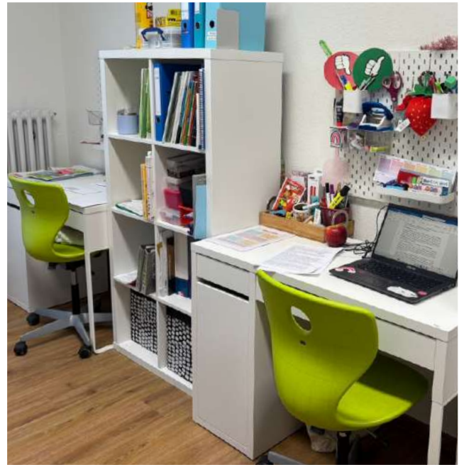
© Schule am Mainbach (Jutta Keßler)