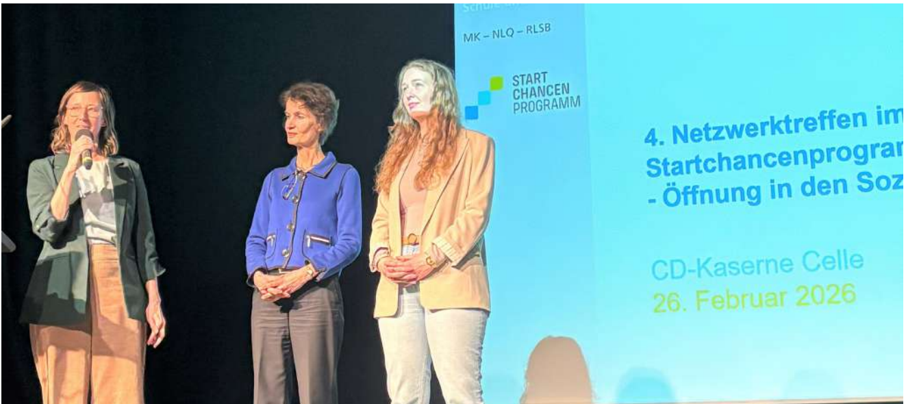
Das Celle-Tandem und die Fachberaterin für schulische Sozialarbeit im SCP stellen sich vor.