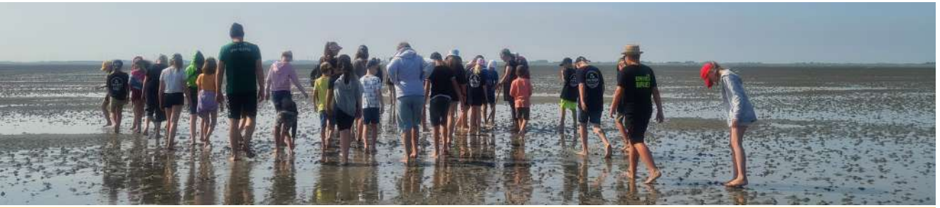
Für Entdecker – die Wattwanderung.

Abends haben wir noch eine Party im Tagesraum veranstaltet. Alle Zelte konnten zwei Lieder aussuchen. Die Stimmung war mega.