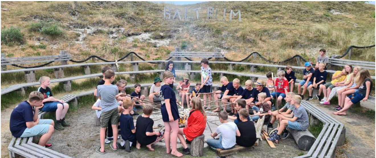
Stockbrotessen in der Arena.