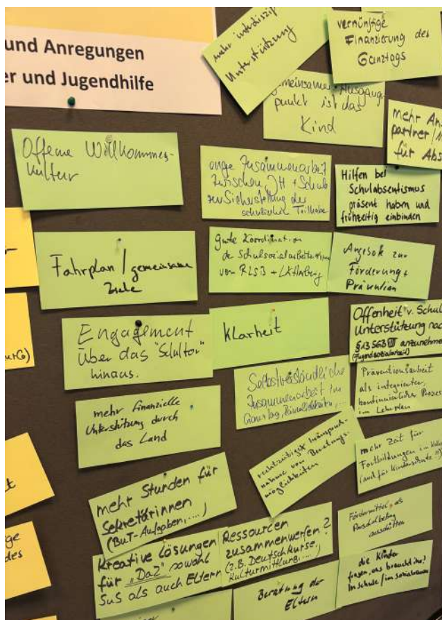
Wünsche der Schulträger für gelingende Kooperationen im Sozialraum.