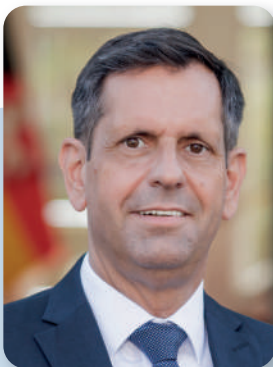
Ministerpräsident Olaf Lies