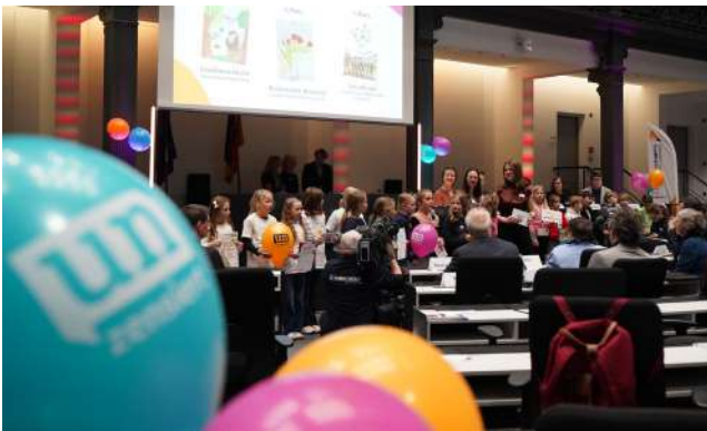
Auszeichnung der besten Schülerinnen- und Schülerzeitungen in Niedersachsen im Landtag.

Die besten Schülerzeitungen Niedersachsens 2026 sind kürzlich im Landtag in Hannover gekürt worden. Die Auszeichnung wird jährlich vom Verein „Junge Presse Niedersachsen“ (JPN) verliehen. Beim Wettbewerb „Unzensiert“ werden journalistische Arbeiten von Schülerinnen und Schülern bzw. Redaktionsteams prämiert. Eine Jury aus Profi- und Nachwuchsjournalistinnen und -journalisten wählt die Gewinnerinnen und Gewinner aus verschiedenen Schulformen aus. Die jeweils drei besten Redaktionen jeder Schulform erhalten Geld- und Sachpreise.