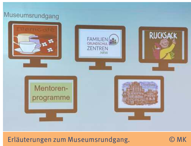
Erläuterungen zum Museumsgang.

Um die jeweils über 80 Teilnehmerinnen und Teilnehmer auf das Thema einzustimmen und ihnen zum Teil vertraute als auch neue, kreative Ansätze zu präsentieren, waren Projekt-sammlungen zentraler Bestandteil der Netzwerktreffen. Im Lüneburger Netzwerk haben Carola Gruchatka-Denien (Startchancen-Beraterin) und Silke Ranze (Beraterin für Evaluation) als Beratungstandem einen „Museumsgang“ durch die Ausstellungen der präsentierten Projekte zur Sozialraumöffnung geplant.