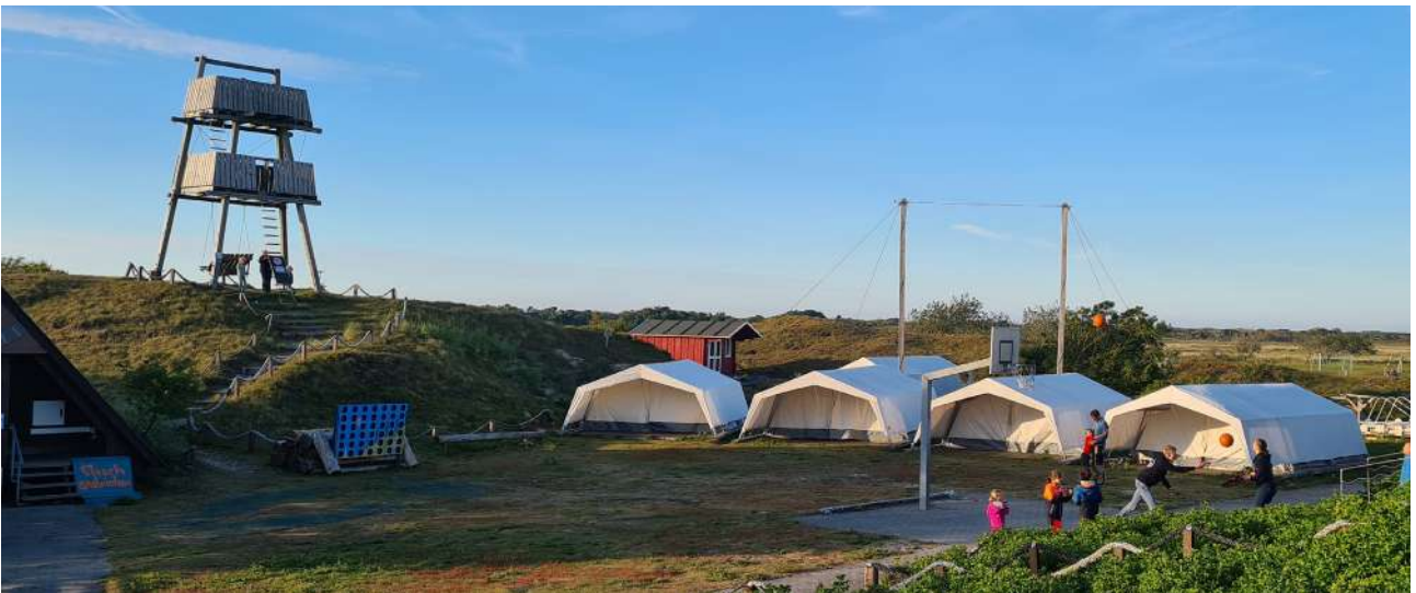
Das Camp auf Baltrum.