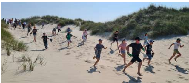
Auf dem Weg zum Strand.

Es gibt viele Möglichkeiten zum Spielen, Toben, Entdecken und auch Ecken zum Chillen.