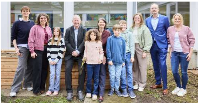
Ministerin Miriam Staudte (6. v. l.) gemeinsam mit den Projektbeteiligten sowie Schülerinnen und Schülern der Grundschule Wettbergen.

Mit dem landesweiten Projekt „Ernährungsbildung stärken – Mensen zu Lernorten“ startet Niedersachsen eine neue Initiative, um Schulmensen verstärkt als pädagogische Lernorte zu nutzen. Ernährungsministerin Miriam Staudte gab den offiziellen Auftakt an der Grundschule Wettbergen. Insgesamt erhalten sieben ausgewählte Schulen im Land eine Förderung von 1,2 Millionen Euro, um Konzepte für eine zeitgemäße Ernährungsbildung zu entwickeln und umzusetzen. Im Mittelpunkt des Projekts steht die Idee, dass Kinder und Jugendliche nicht nur satt werden, sondern durch praktische Erfahrungen ein gesundes Essverhalten, ein Bewusstsein für Lebensmittel und gemeinsame Esskultur entwickeln.